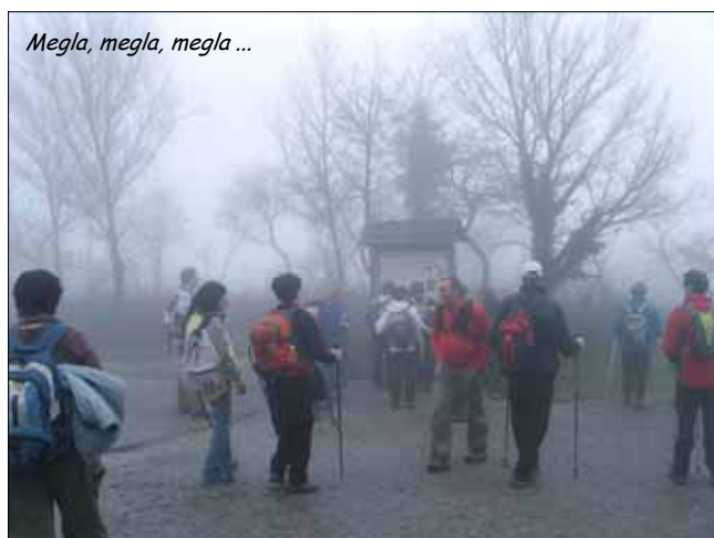
Megla, megla, megla ...

oblačno in začelo je rositi. Nevio nas je pričakal na nekdanjem mejnem prehodu z Italijo. Razveselili smo se ga in skupaj smo se odpeljali do Doline pri Trstu, kjer smo izstopili in vzeli pot pod noge. Rosilo ni več,