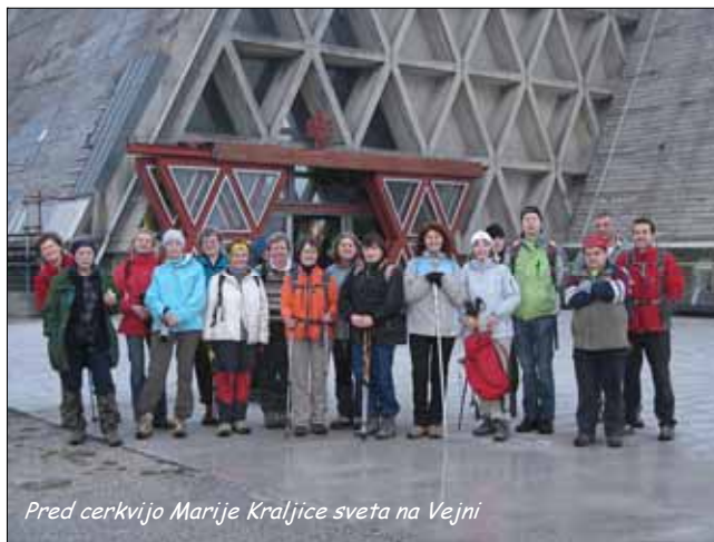
Pred cerkvijo Marije Kraljice sveta na Vejni